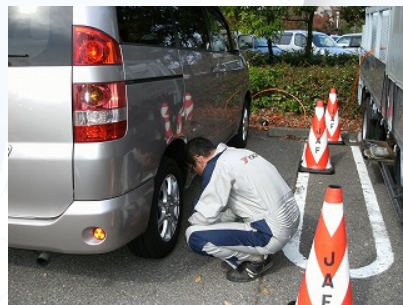
ほとんどの点検車両が空気圧不足でした