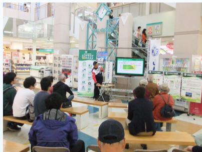
JAFによるエコドライブ講習会

11月の「エコドライブ推進月間」にあわせ、市内ショッピングセンターでキャンペーンを実施しました。石川県タイヤ商工協同組合と一般社団法人日本自動車連盟(JAF)と連携し、 エコドライブ講習会 や燃費の改善につながる タイヤの空気圧チェック・調整 を実施し、市民へ広くエコドライブを普及啓発しました。